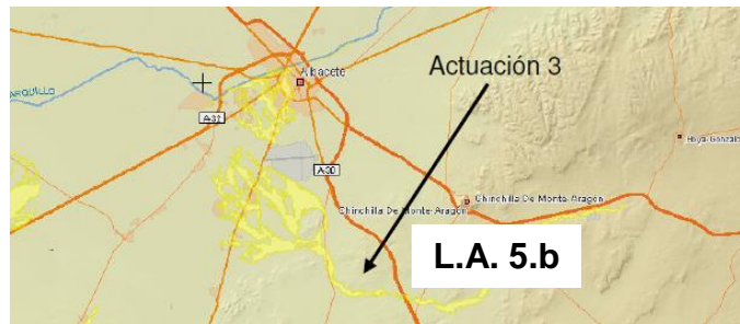
Figura 9.2: Zona de actuación 5.b en el término municipal (dentro del ámbito del OT5).